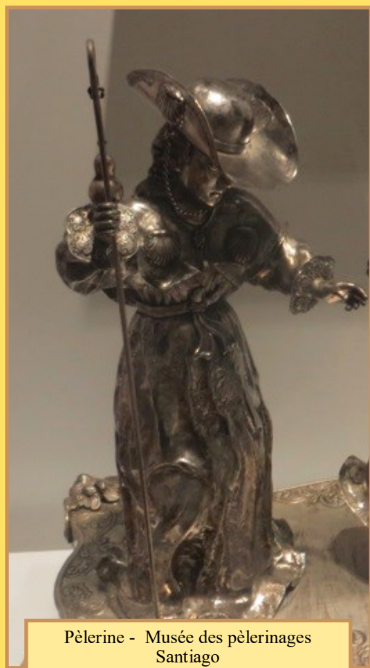
Pèlerine - Musée des pèlerinages Santiago