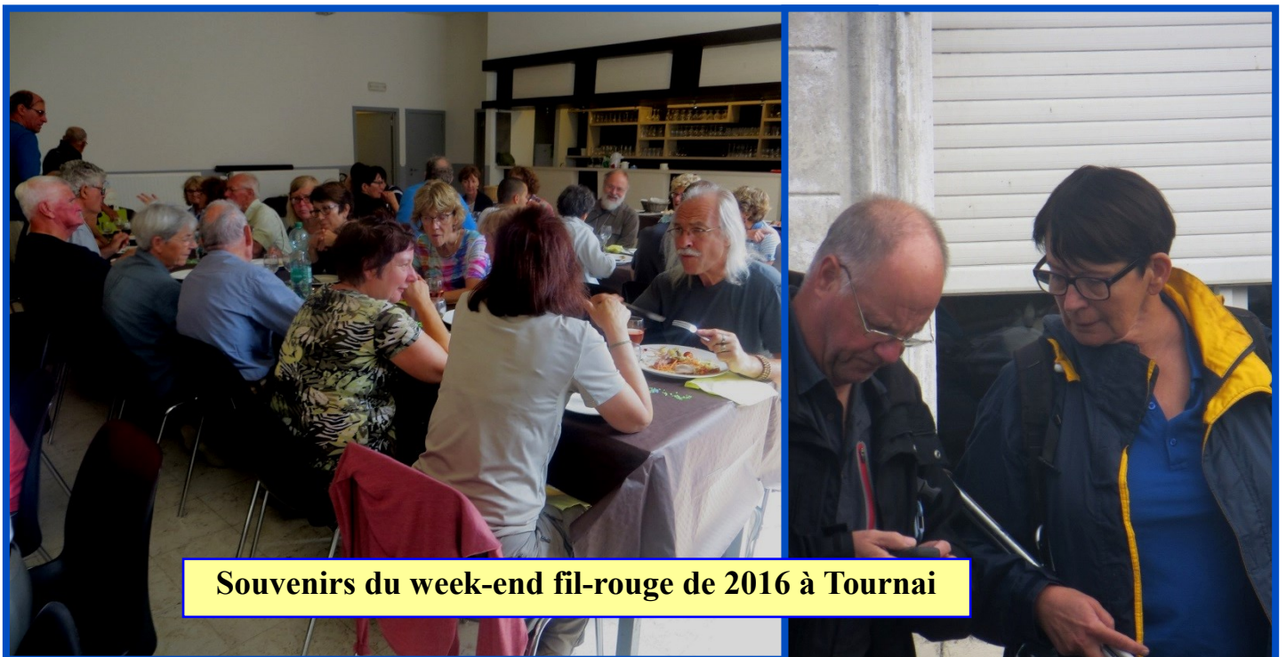
Souvenirs du week-end fil-rouge de 2016 à Tournai

Ne tardez pas à vous inscrire ! Nombre de places limitées à 20 pour les membres de notre association. Une liste d'attente sera éventuellement créée. Date limite : le 28 février 2023