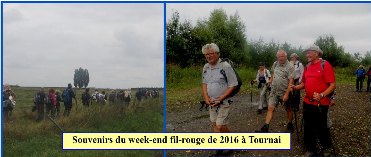
Souvenirs du week-end fil-rouge de 2016 à Tournai

Inscription obligatoire à envoyer pour le 28 février 2023 au plus tard