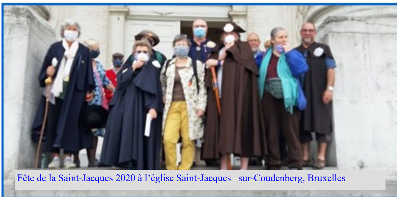
Fête de la Saint-Jacques 2020 à l'église Saint-Jacques –sur-Coudenberg, Bruxelles

Nous serons également présents au départ de la balade animée « Du Namurois à Compostelle, premiers pas de pèlerins » organisée par le Service Culturel et du Patrimoine de la Province de Namur.