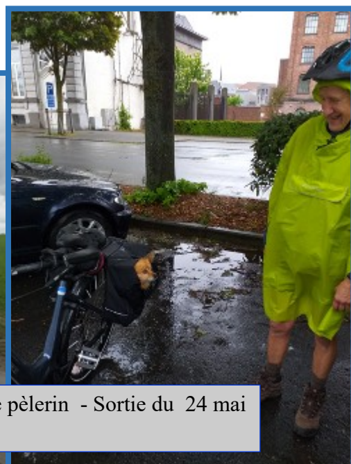
Pluie du matin n'arrête pas le pèlerin - Sortie du 24 mai dernier sur la Via TENERA