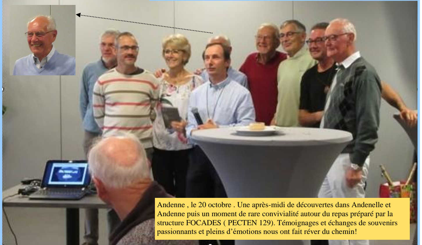
Andenne , le 20 octobre . Une après-midi de découvertes dans Andenelle et Andenne puis un moment de rare convivialité autour du repas préparé par la structure FOCADES ( PECTEN 129). Témoignages et échanges de souvenirs passionnants et pleins d'émotions nous ont fait rêver du chemin!